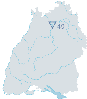
Lauffen am Neckar